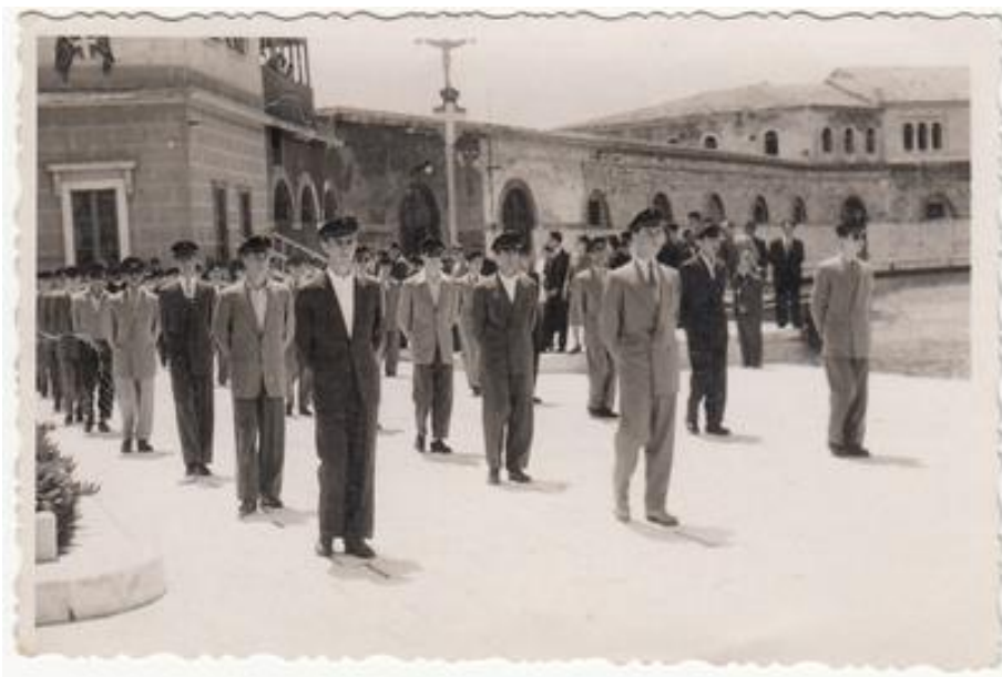
Η ογδόη τάξη του γυμνασίου Σύρου, στην περιφορά της Αγίας Εικόνας