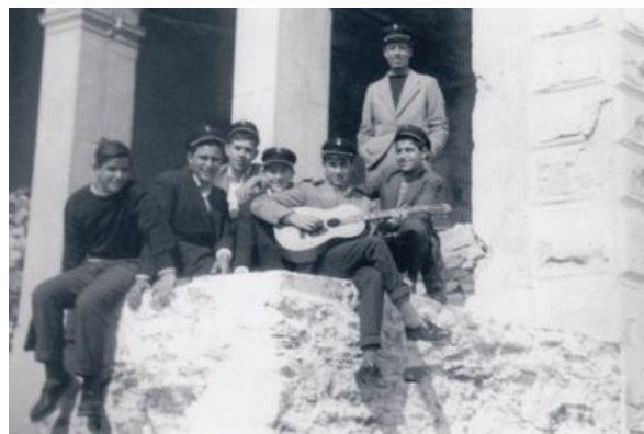
Εκδρομή στην «Δόξα» Φεβρ. 1958