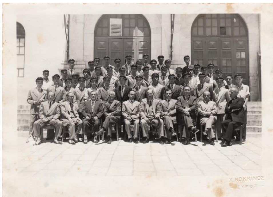
Οι απόφοιτοι του Ιστορικού Γυμνασίου Σύρου, με τους καθηγητές τους στις 14 Ιουνίου 1952. Η τελευταία μέρα που οι μαθητές αυτής της τάξης, φορούν το πηλίκιο.