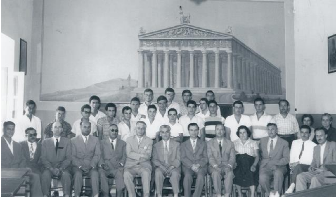
Γυμνάσιον Αρρένων Σύρου Αίθουσα Παρθενώνας. Αποφοίτηση Η' τάξεως 28-6-1960